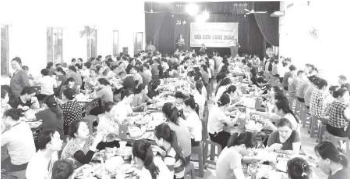
CĐCS Công ty CP sản xuất đầu tư và thương mại TAAD tổ chức Bữa cơm công đoàn cho toàn thể CNLD Công ty

Nam trong gần một thế kỷ hình thành và phát triển; góp phần củng cố, bồi đắp niềm tin của đoàn viên, người lao động đối với tổ chức Công đoàn Việt Nam. Triển khai thực hiện có hiệu quả mục tiêu, chỉ tiêu, khâu đột phá của Nghị quyết Đại hội XIII Công đoàn Việt Nam, các nhiệm vụ trọng tâm năm 2024.