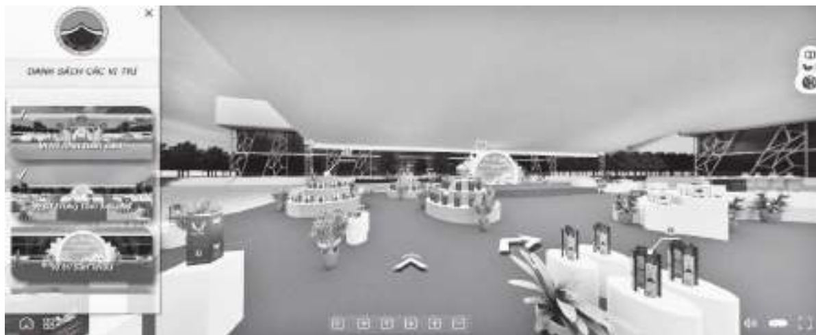
Hội chợ triển lãm trực tuyến bằng công nghệ thực tế ảo 3D

Tổ chức các lớp tập huấn về quản trị doanh nghiệp trên nền tảng chuyển đổi số, các kỹ năng livestream bán hàng trên các nền tảng mạng xã hội như TikTok, Facebook và Shopee. Đây là một trong những nỗ lực giúp các doanh nghiệp CNNT tận dụng tối đa các công cụ công nghệ hiện đại để tiếp cận khách