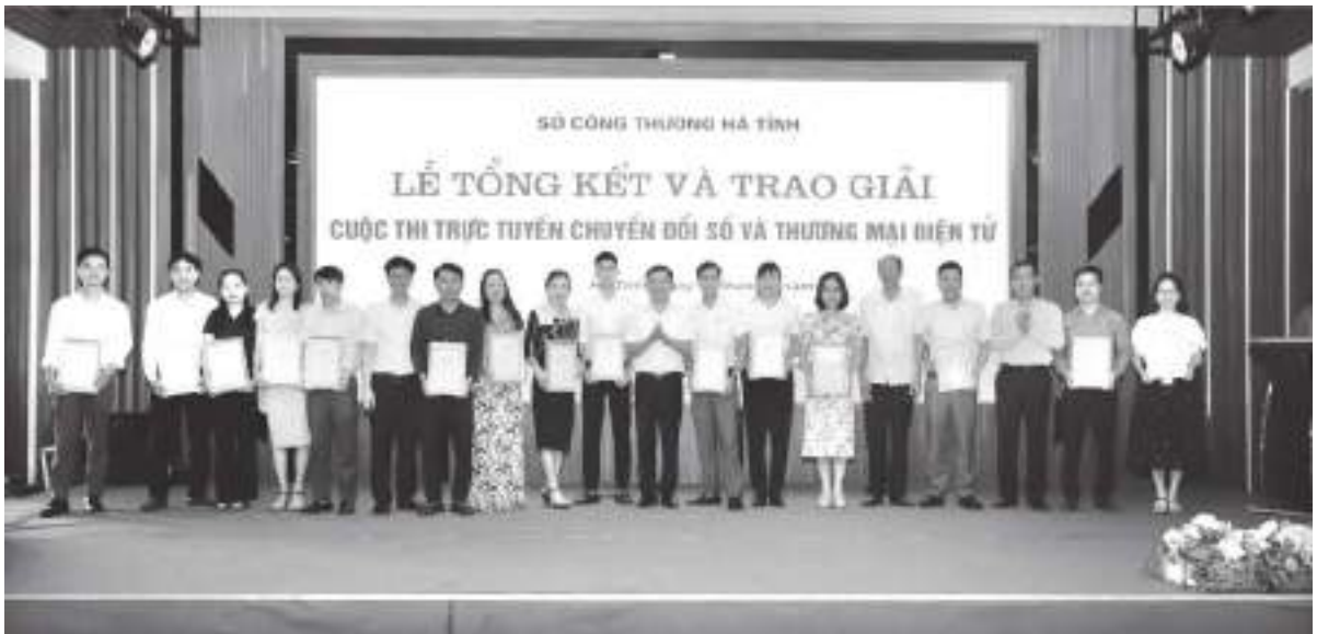
Ban Tổ chức Cuộc thi trực tuyến về Thương mại điện tử và chuyển đổi số trao giải cho các cá nhân, đơn vị đạt giải

biểu, sản phẩm nông sản chủ lực của tỉnh, số lượt truy cập mỗi tháng đạt khoảng 15.000-18.000 lượt. Bên cạnh đó, tập huấn, hướng dẫn các cơ sở xây dựng thương hiệu, bán hàng trên sàn thương mại điện tử lớn như shopee, lazada, posmart và trên các nền tảng mạng xã hội như facebook, zalo, tiktok.