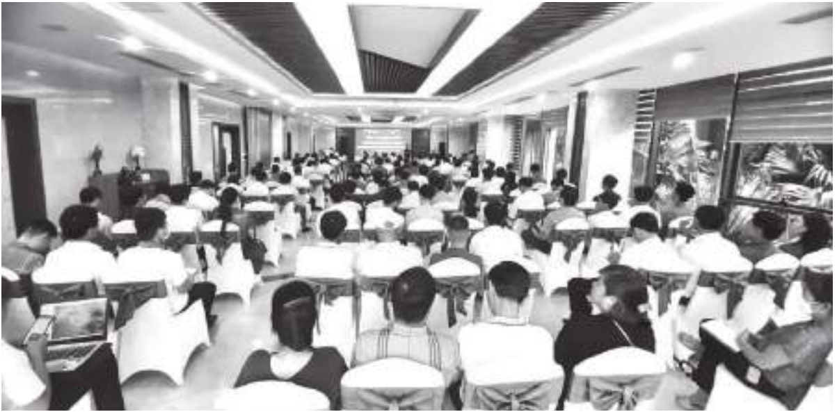
Học viên tham gia tập huấn về thương mại điện tử

thông tin tại Sở Công Thương. Tiếp tục ứng dụng công nghệ thông tin trong cải cách hành chính, cung cấp dịch vụ công trực tuyến lĩnh vực Công Thương, niêm yết mã Qrcode link tới trang thanh toán phí, lệ phí trực tuyến trên Cổng thông tin điện tử của Sở Công Thương. Tuyên truyền, phát động cán bộ, công chức, viên chức, người dân và doanh nghiệp hưởng ứng các sự kiện như Ngày chuyển đổi số quốc gia, Tháng tiêu dùng số và Tuần lễ thương mại điện tử.