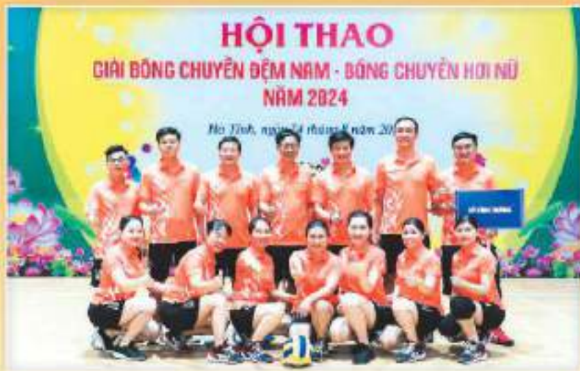
Đoàn vận động viên Sở Công Thương tại Hội thao giải bóng chuyền đệm nam - bóng chuyền hơi nữ do Khố Kinh tế - Kỹ thuật tổ chức