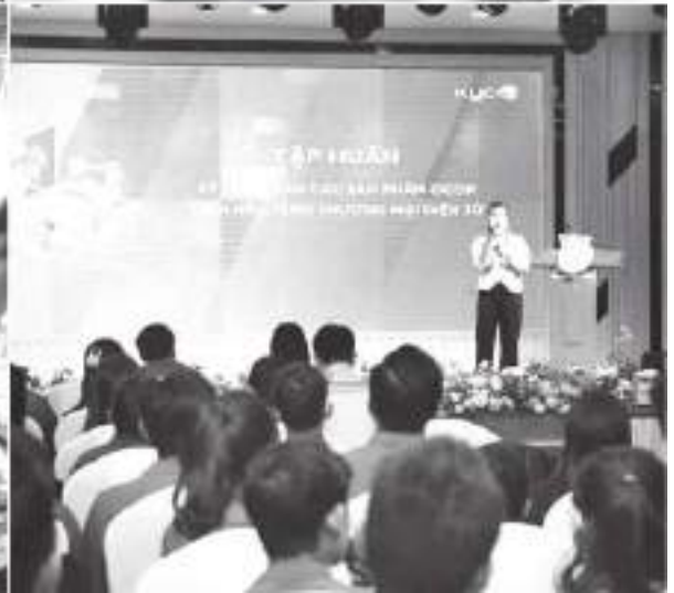
Chuyển đổi số giúp người dân, Hợp tác xã trên địa bàn tỉnh tiếp cận những cách làm hay để phát triển kinh tế trên môi trường số

hóa đơn điện tử theo từng lần bán hàng (đạt 100%), trong đó: Số CHXD thực hiện giải pháp tự động truyền dữ liệu từ trụ cột bơm đến máy tính phát hành HĐĐT là: 143 cửa hàng, tương ứng 550 cột bơm. Số CHXD thực hiện giải pháp sử dụng máy POS là: 84 cửa hàng, tương ứng 289 cột bơm. Số CHXD thực hiện giải pháp truyền dữ liệu xuất hóa đơn qua APP từ điện thoại là: 01 cửa hàng, tương ứng 02 cột bơm; 05 CHXD mặt nước và 01 điểm bán xăng dầu bằng thiết bị bán xăng dầu quy mô nhỏ: chưa thực hiện, Đến hết tháng 07/2024 có 406.735 khách hàng thực hiện thanh toán tiền điện không dùng tiền mặt trên tổng số 476.735 khách hàng thực hiện thanh toán trong tháng,