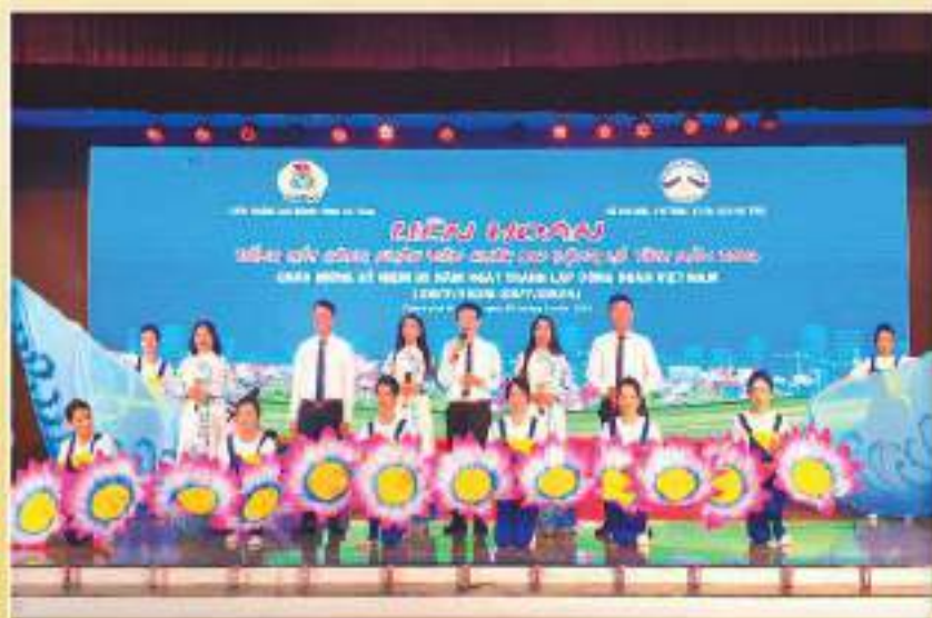
Thết mục hát mùa Công đoàn ngành Công Thương tại Liên hoan Tiếng hát CNVCLĐ toàn tỉnh