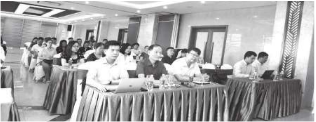
Tập huấn chuyển đổi số cho các cơ sở CNNT

2025, định hướng đến năm 2030; Quyết định số 424/QĐ-UBND ngày 18/02/2022 của UBND tỉnh phê duyệt Đề án Chuyển đổi số trên địa bàn tỉnh Hà Tĩnh giai đoạn 2021 - 2025; Kế hoạch số 58/KH-UBND ngày 11/3/2022 về thực hiện Đề án “Đẩy mạnh ứng dụng công nghệ thông tin và chuyển đổi số trong hoạt động xúc tiến thương mại” trên địa bàn tỉnh Hà Tĩnh năm 2022 và giai đoạn 2022 - 2025...).